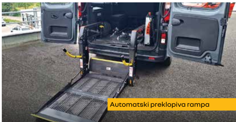
Automatski preklopiva rampa

Financijski leasing // Nominalna kamatna stopa 6,5% // Trajanje financiranja: 60 mjeseci // Učešće: 27% // Ostatak vrijednosti: 0% KASKO, AO, održavanje nisu uključeni u iznos rate // Ponuda je isključivo informativna i nije obavezujućeg karaktera