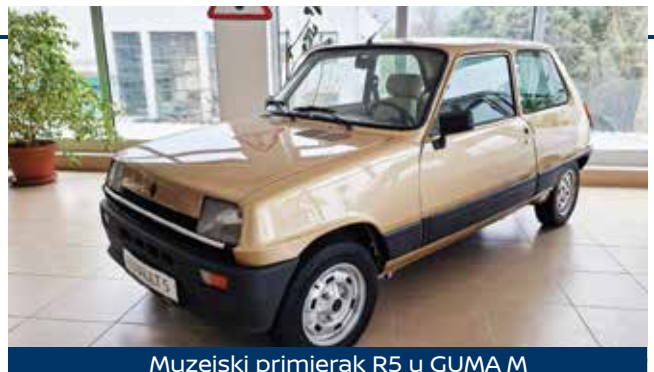
Muzejski primjerak R5 u GUMA M

Renault 5 čija je proizvodnja trajala od 1972. do 1996., postao je jedan od najkoničnijih gradskih automobila s više od 5,5 milijuna prodanih primjeraka . Njegov kompaktni dizajn i pouzdanost učinili su ga savršenim izborom za svakodnevnu vožnju. Posebno su se isticale sportske verzije, poput Renault 5 Alpine i legendarnog Renault 5 Turbo, koji je briljirao na reli stazama. Bio je simbol svoje ere, omiljen među mladima i vozačima koji su tražili praktičnost s dozom karaktera.