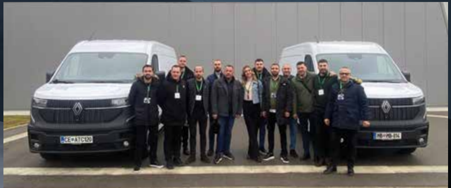
Kolege na edukaciji u Sloveniji, posvećenju novom Renault Masteru!