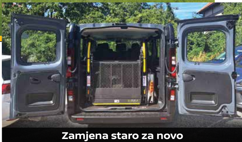
Zamjena staro za novo

Jedna od ključnih prednosti ove konverzije je izbjegavanje rezanja stražnjeg branika, čime se zadržava originalna struktura vozila i njegova trajnost.