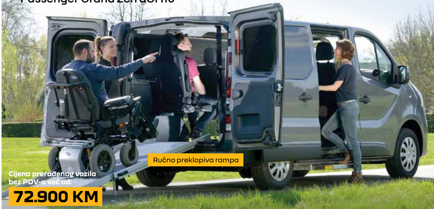
Ručno preklopiva rampa

Cijena prerađenog vozila bez PDV-a već od: