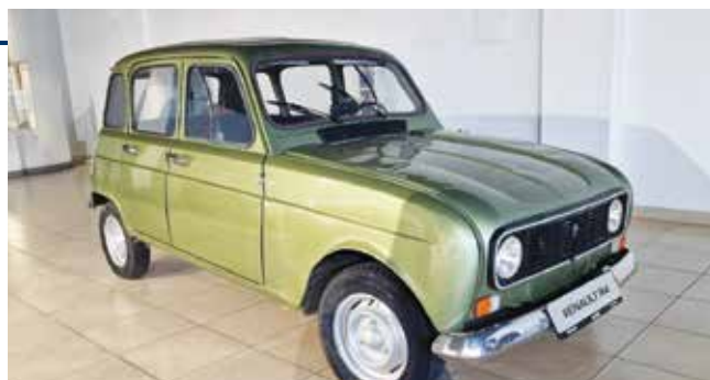
Muzejski primjerak R4 u GUMA M

Ikona prošlosti u električnoj budućnosti.