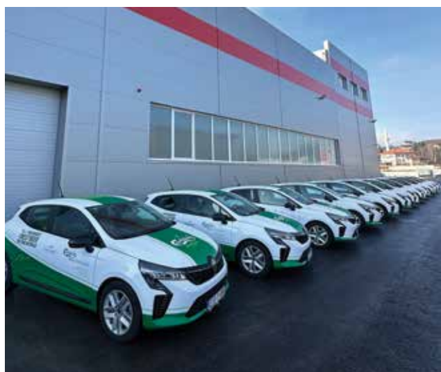
Priprema flotne isporuke